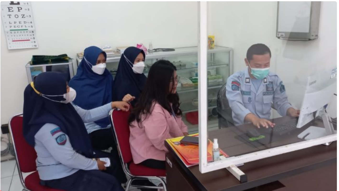
Klinik Pratama Rawat Jalan Lapas Purwokerto Terapkan Rekam Medis Elektronik dengan Aplikasi Klinik Pintar

PURWOKERTO – Klinik Pratama Rawat Jalan Lembaga Pemasarakatan Kelas IIA Purwokerto telah memperoleh Surat Ijin Operasional Klinik sejak 28 Maret 2023, dan telah terdaftar sebagai Fasilitas Pelayanan Kesehatan di Kementerian Kesehatan Republik Indonesia dengan kode Fasyankes: 1239299.